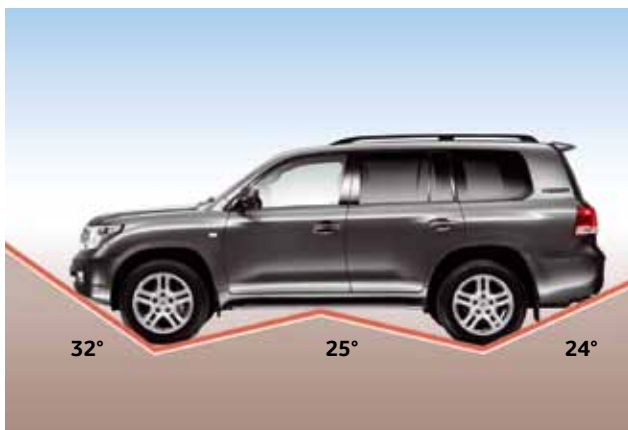
Kąt natarcia 32°, kąt zejścia 24° i kąt rampowy 25°