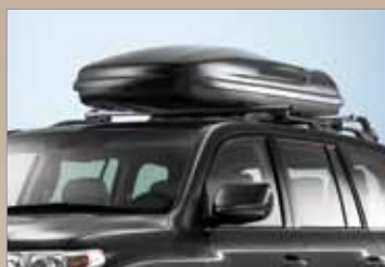
BOX BAGAŻOWY 390 L