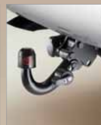
HAK HOLOWNICZY DEMONTOWANY