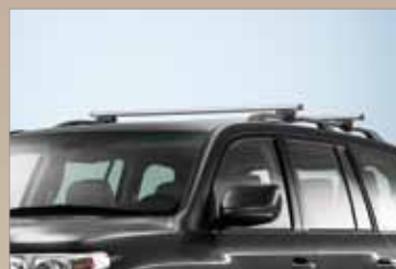
BAGAŻNIK DACHOWY NA RELINGI