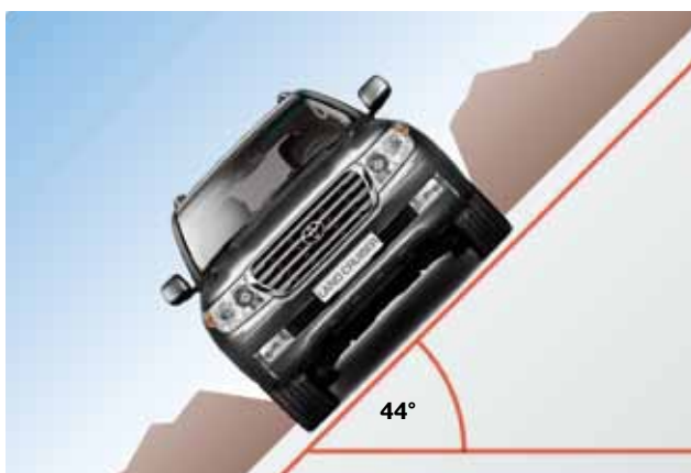
Maksymalny przechył boczny 44°