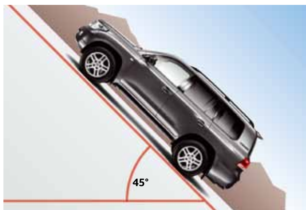
Zdolność pokonywania wzniesień 45°